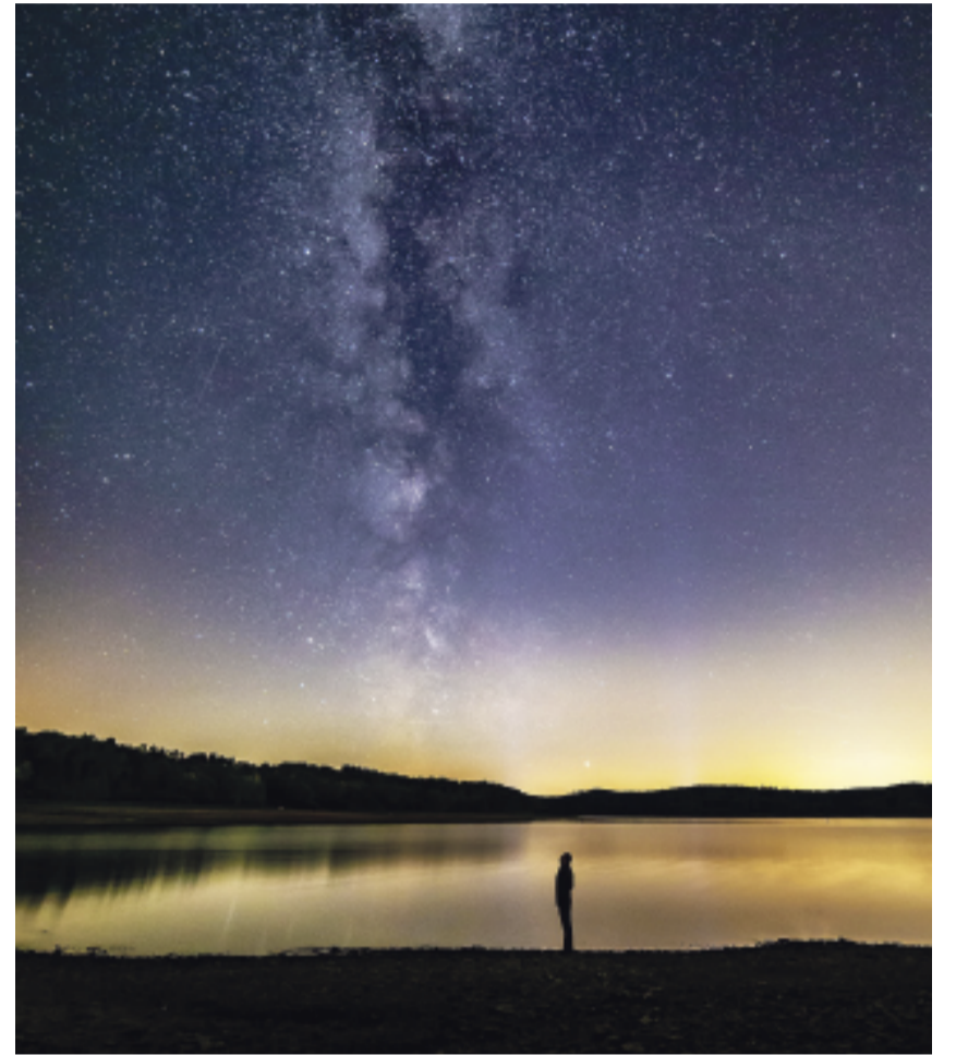
Mensch und Milchstrasse

Es geht um Gerechtigkeit Jesus verkündete ein Gottesbild, das keineswegs harmlos ist. In den Evangelien lesen wir von einem Weltgericht und der Verantwortung, die wir als Menschen für unser Tun haben. Es geht dabei um die Frage nach der Gerechtigkeit. Der Gott der Bibel ist einer, der die Armen, die Unterdrückten und Geschundenen dieser Welt zu ihrem Recht kommen lassen will. Um die Johannesoffenbarung zu verstehen, sollte man sie lesen als eine theologische Interpretation der damaligen Geschichte und der Mächte, die sie lenkten. Kleinasien, das Gebiet der heutigen Türkei, war zu dieser Zeit eine der blühendsten Wirtschaftsregionen des römischen Weltreiches. Der herrschende erste römische Kaiser Domitian (51–96 n.Chr.) bezeichnete sich als «Herr