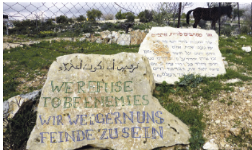
Wichtige Botschaft an Gewaltbereite (auf palästinensischem Grundstück bei Bethlehem)

• Das Land und seine Bewohner:innen sahen viele Herrschaften, Kulturen und Religionen kommen und gehen. Alle haben ihre Spuren hinterlassen. Seit Beginn geschichtlicher Zeit dominierten da kanaanitische Kleinstaaten, lange unter ägyptischer Kontrolle. Dann tauchten die Kleinkönigreiche Israel und Judäa auf, verloren nach wenigen Jahrhunderten ihre Autonomie an Assyrien, Babylonien und Perser. Dann lösten sich während Jahrhunderten Griechen und Römer als Eroberer ab, unterbrochen von einem weiteren Jahrhundert jüdischer Teilautonomie. Ab ca. 300 n. Chr. wurde Rom und damit auch das Land mehrheitlich christlich, um im 7. Jhd. von islamischen Herrschern in die Minderheit versetzt zu werden. So blieb es (mit Unterbrechung durch die Kreuzzüge) die nächsten fast anderthalb Jahrtausende, bis mit den Briten eine europäische Kolonialmacht und in ihrem Gefolge europäische Juden wieder neue Machtverhältnisse schufen, die den heutigen Konflikt wesentlich mitverursachten. Lässt sich ein Alleinanspruch auf das Land aus dieser Geschichte ableiten?