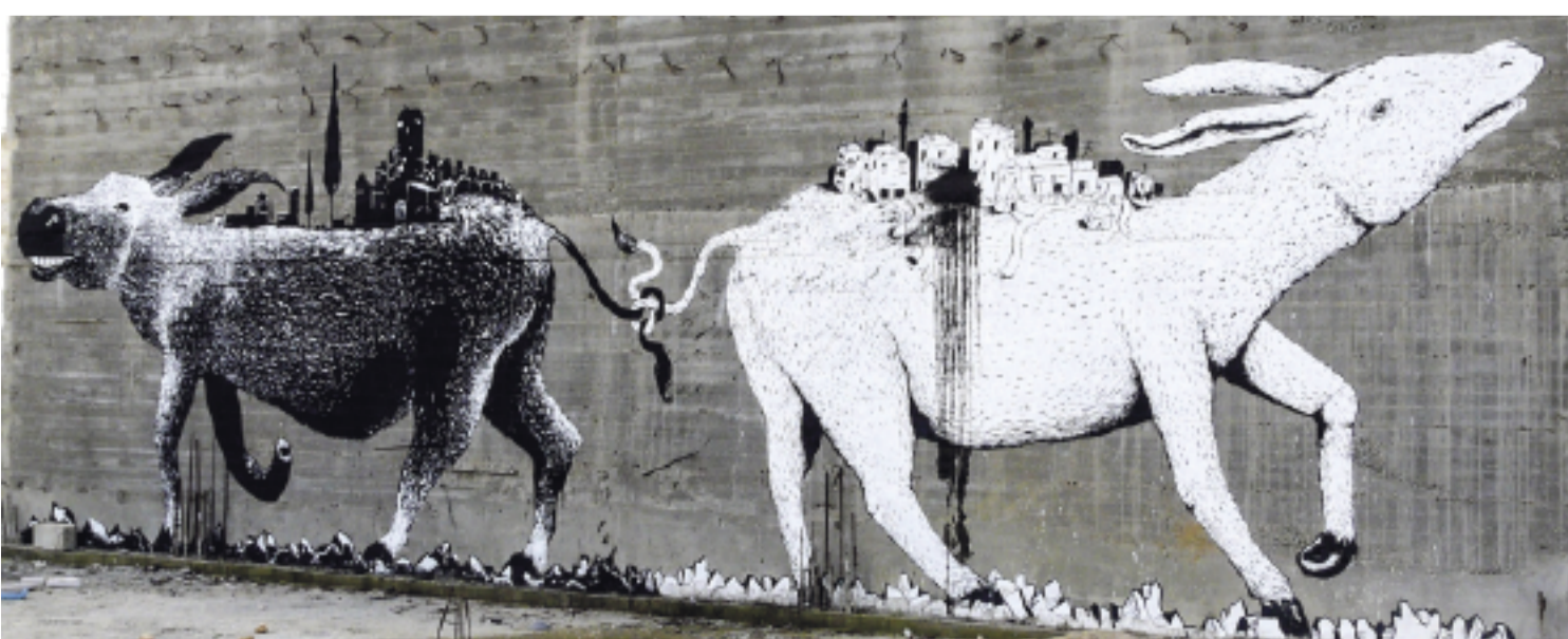
Trotz allem untrennbar miteinander verknottet: Die beiden nahöstlichen Esel! (Mauer-Graffiti in Bethlehem)